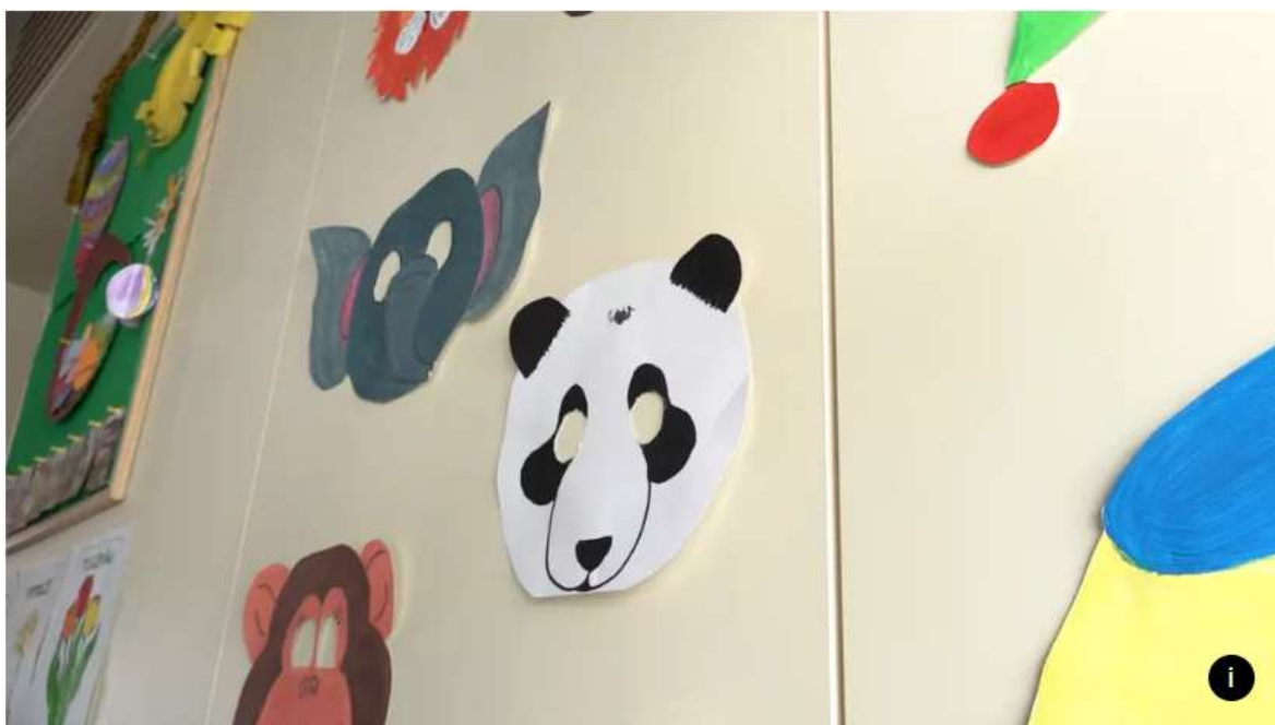
Děti s poruchou autistického spektra raketově přibývá.

Podle přednosta psychiatrické kliniky při Fakultní nemocnici v pražském Motole Michala Hrdličky strmě narůstá počet novorozenců s poruchou autistického spektra. Na 36 narozených dětí připadá podle amerických lékařů jedno dítě s autismem.