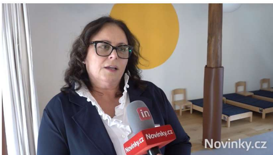
Otevření centra pro lidi s autismem

V souvislosti s výročím Světového dne porozumění autismu, které proběhlo 2. dubna, byl zveřejněn poslední výpočet prevalence výskytu této nemoci u dětí. Na 36 narozených dětí připadá podle amerických lékařů jedno dítě s autismem. Vznikají proto i místa, kde mohou děti s touto vývojovou poruchou trávit čas bez rušení a podle vyhovujících pravidel. Co musí takové denní centrum pro