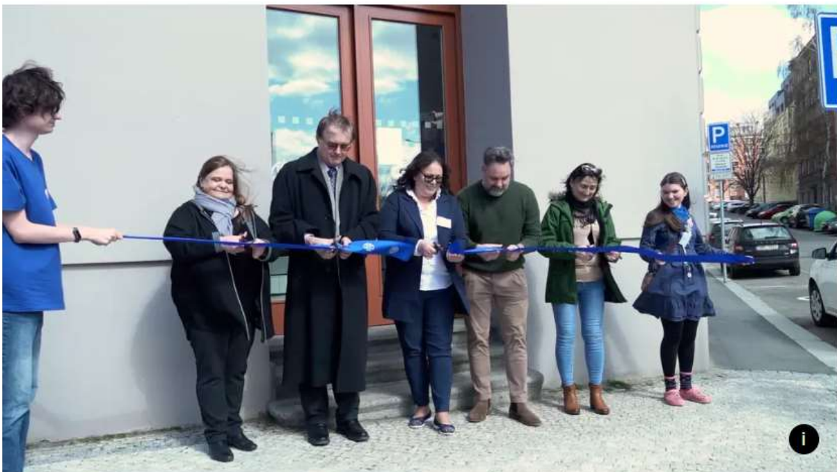
Otevření centra v pražské ulici U vršovického nádraží

Prostor se zakladatelé centra snažili přizpůsobit všem formám a projevům choroby. Všechny místnosti tak navrhli podle svého know-how, které již několik let aplikují ve svém druhém působišti v Jihlavě.